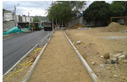
Calle 24 Sur entre Carrera 40 y Carrera 32