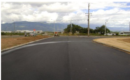
Carrera 52 entre Calle 8 y Calle 19