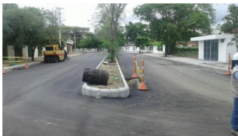
Carrera 10 Entre Calle 4 sur y Calle 19 Sur