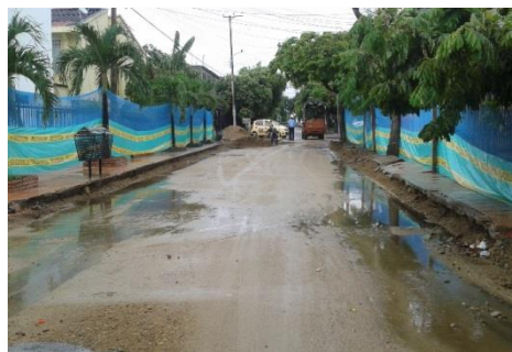
Carrera. 28 entre Calle 20 y Calle 18